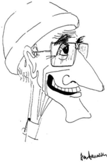
Foto nr. 7. Caricatură reprezentându-l pe Jacques-Yves Cousteau.